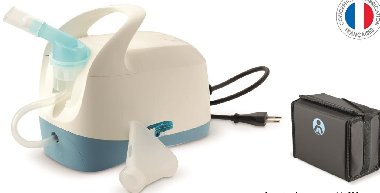
Sacoche de transport M1630 en option